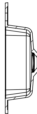
PRZEKRÓJ H-H SKALA 1 : 10